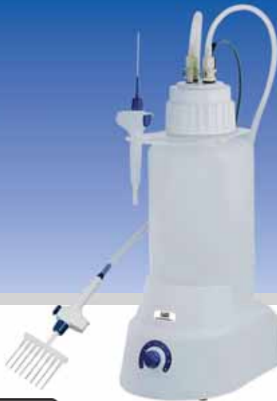
Sistema de aspirado